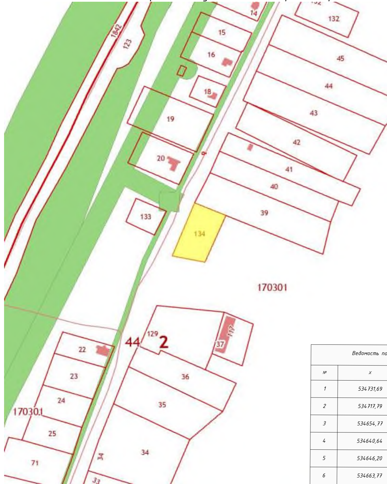
Выкопировка из публичной кадастровой карты